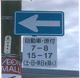
時間帯により北方面への通行のみ